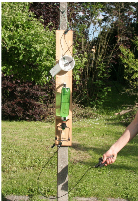
Slika 1: Slika rampe od spredaj

Plastenko sem pritrdil na merilno rampo tako, da je v začetni legi stala na pritrjenem nosilcu. Tik nad raketo je bil postavljen merilnik sile.