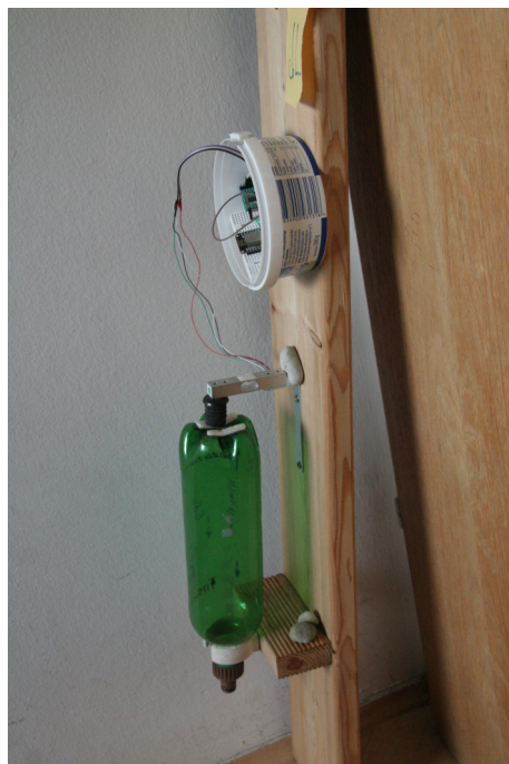
Slika 2: Slika rampe od strani